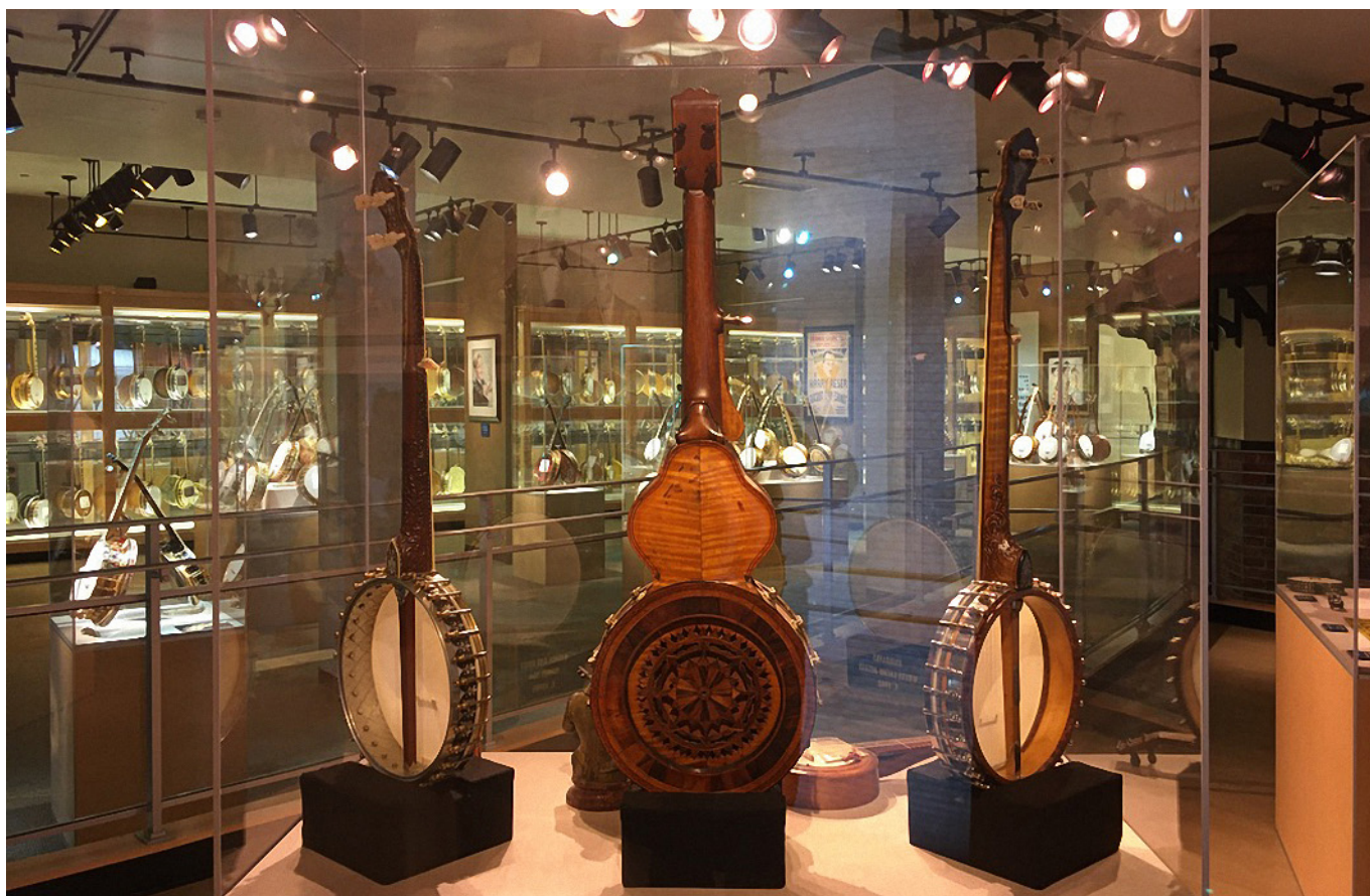
Instruments de la collection de James Bollman. Exposition à l'ABM en 2019.