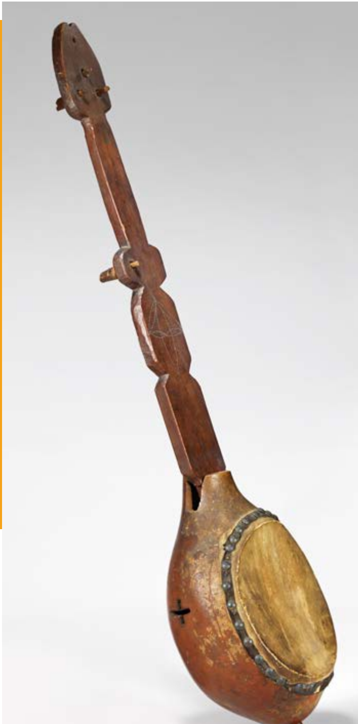
'Banza haïtien'. Banjo gourde collecté par Victor Schoelcher avant 1840. Entré au Musée du Conservatoire national de musique en 1872. Inv. E.415. Longueur 88 cm. Après notre exposition, le luthier Pete Ross en produira plusieurs fac-similés.

La première version commercialisée du banjo à cinq cordes, par W.E. Boucher à partir des années 1840. Exposition The Banjo in Baltimore and Beyond, BVM Museum, Baltimore, MA, 2014. Coll. P. Szego. Baltimore était à la croisée des chemins des troupes du minstrel show. Preuve d'un intérêt marqué pour l'histoire et la signification du banjo à cinq cordes, plusieurs expositions thématiques furent montées aux États-Unis dans les années 2000. En 2005-2006, la Corcoran Gallery, à Washington DC, a utilisé cette même peinture (The Banjo Player) pour l'affiche de Picturing the Banjo, un événement consacré aux représentations du banjo dans les arts. (1)