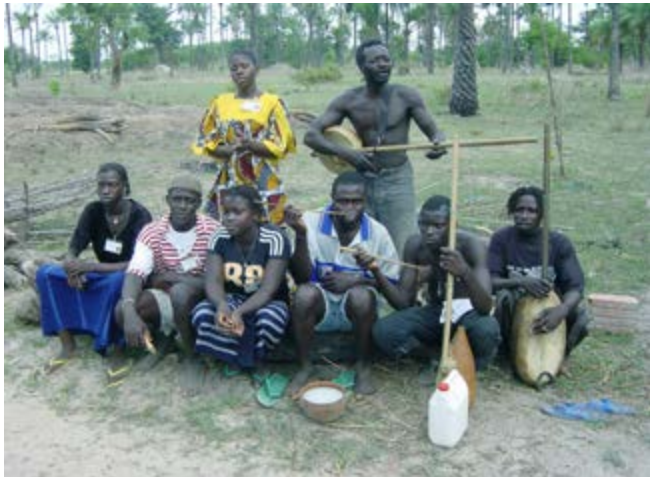
Akonting présenté ici par le 'Sin Jam Bukan de Fasul', un groupe de l'ethnie Jola du sud du Sénégal, originaire de Mlomp. Photographié en 2002 par Ulf Jagfors

ses précurseurs africains. Lors de la préparation de cette exposition, la mise en évidence du 'banza haïtien', provoqua un vif émoi dans la communauté des spécialistes. Une description circonstanciée de cette 'découverte' sera par ailleurs disponible dans plusieurs publications scientifiques, ainsi que sur internet (cfr. infra : Orientations bibliographiques).