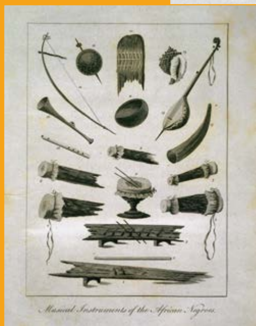
'Creole bania'. Planche extraite du livre de Gabriel Stedman, Voyage à Surinam, et dans l'intérieur de la Guiane... , Paris, 1799, et Londres, 1813. C'est un instrument semblable, mentionné plus haut, qui a été exposé au MIT en 1984 et au MIM en 2003-2004.

Les luths africains primitifs, dont le Musée royal de l'Afrique centrale conserve de nombreux spécimens, présentent selon leurs lieux d'origine de nombreuses particularités. Le banjo, dont le manche traverse de part en part la caisse de résonance, et dont le chevalet repose sur une peau tendue, se rapproche de l'akonting (ou ekonting), un instrument à cordes de longueurs inégales toujours joué en Afrique de l'Ouest. On notera cependant une différence fondamentale quant à la forme du manche qui, contrairement au banjo, est ronde. Bien qu'aucun instrument