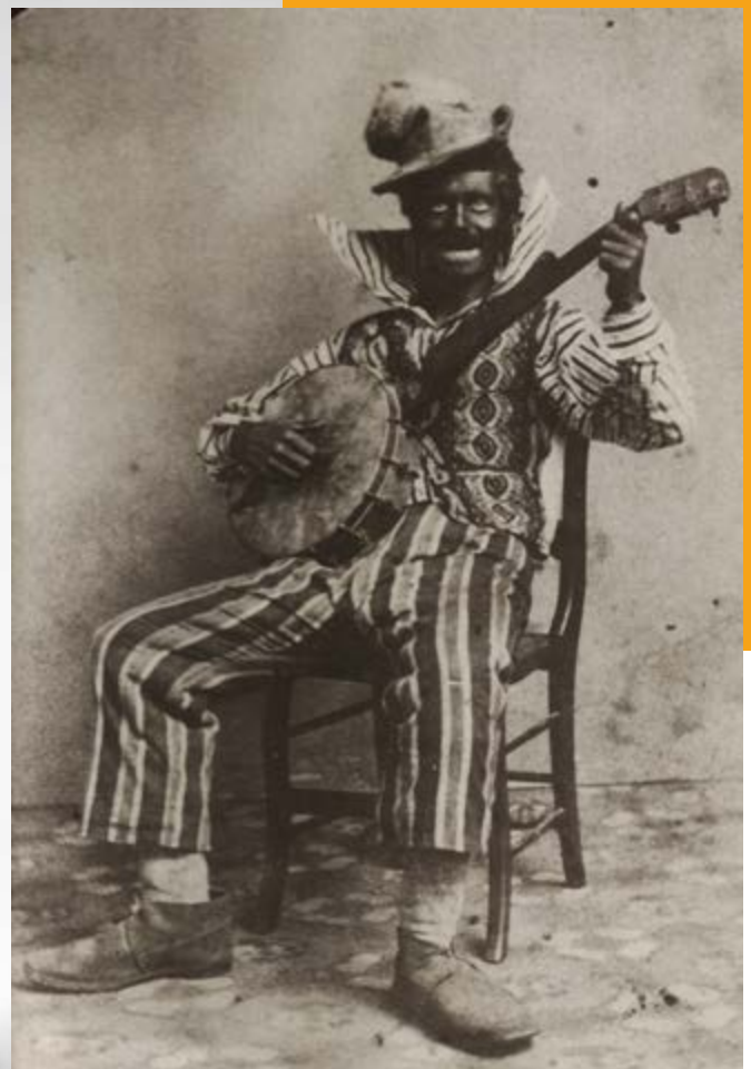
Image typique du minstrel show, tel que répandu des deux côtés de l'Atlantique. Carte de visite, ca. 1860.