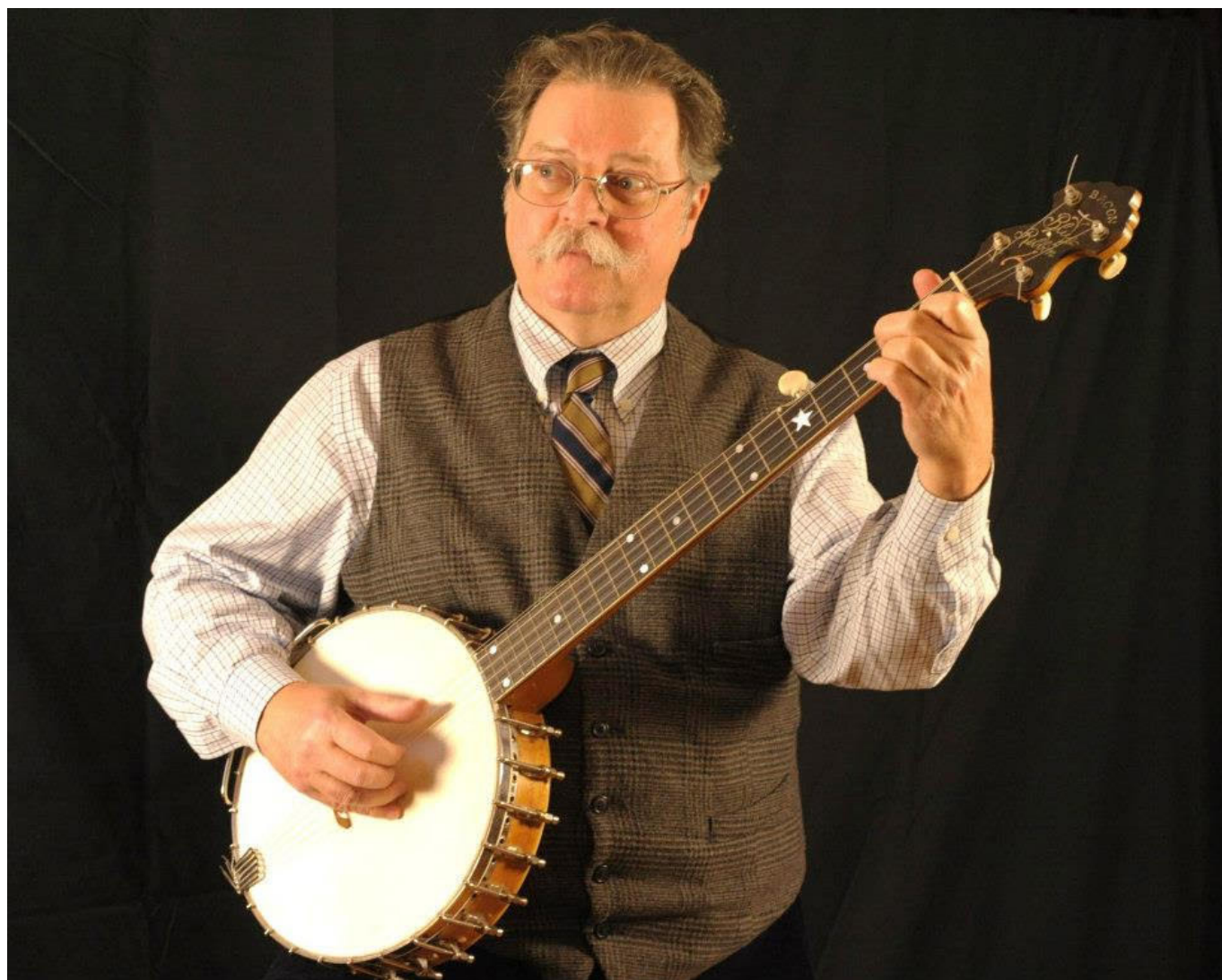
Clarke Buehling, USA.

C'est dans cet état d'esprit que nous rencontrerons l'élégant Clarke Buehling, actif depuis plus de quarante années sur la scène du renouveau du banjo ancien, pour en devenir un de ses plus prestigieux représentants.